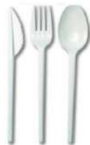
POSATE USA E GETTA