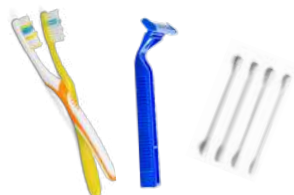
RASOI, SPAZZOLINI, COTTON FIOC