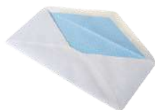
LETTERE E DEPLIANT