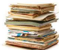
LIBRI E RIVISTE