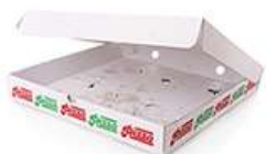
CARTONI DELLA PIZZA VUOTI (ANCHE LEGGERMENTE SPORCHI)