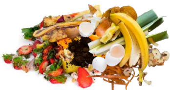
AVANZI DI CIBO