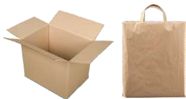
SCATOLE E BUSTE DI CARTA