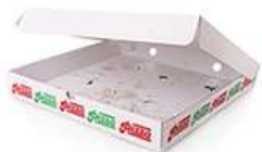
CARTONI DELLA PIZZA VUOTI (ANCHE LEGGERMENTE SPORCHI)